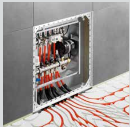
Die Kleinflächenregelstation in Kombination mit Fonterra Reno.